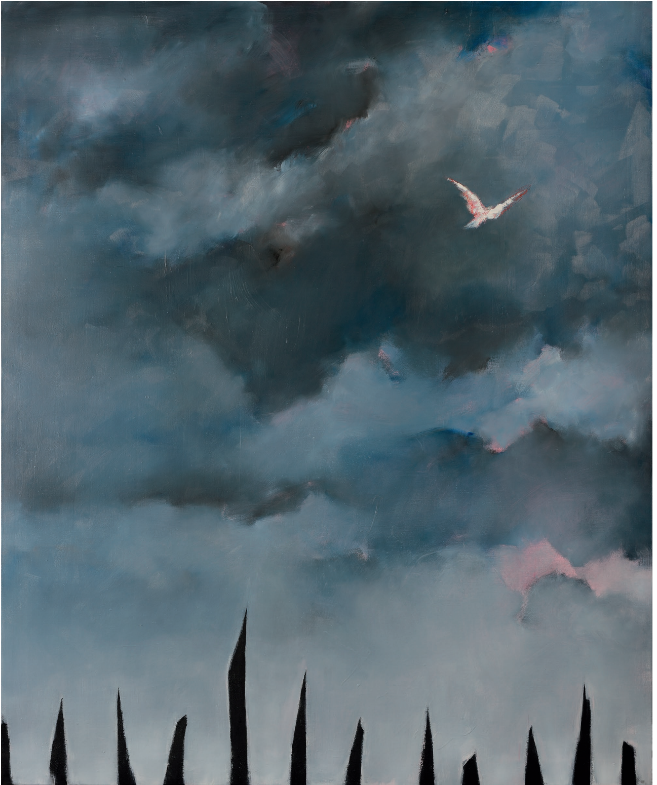
Unerwünscht Öl auf Leinwand, 190 x 220 cm