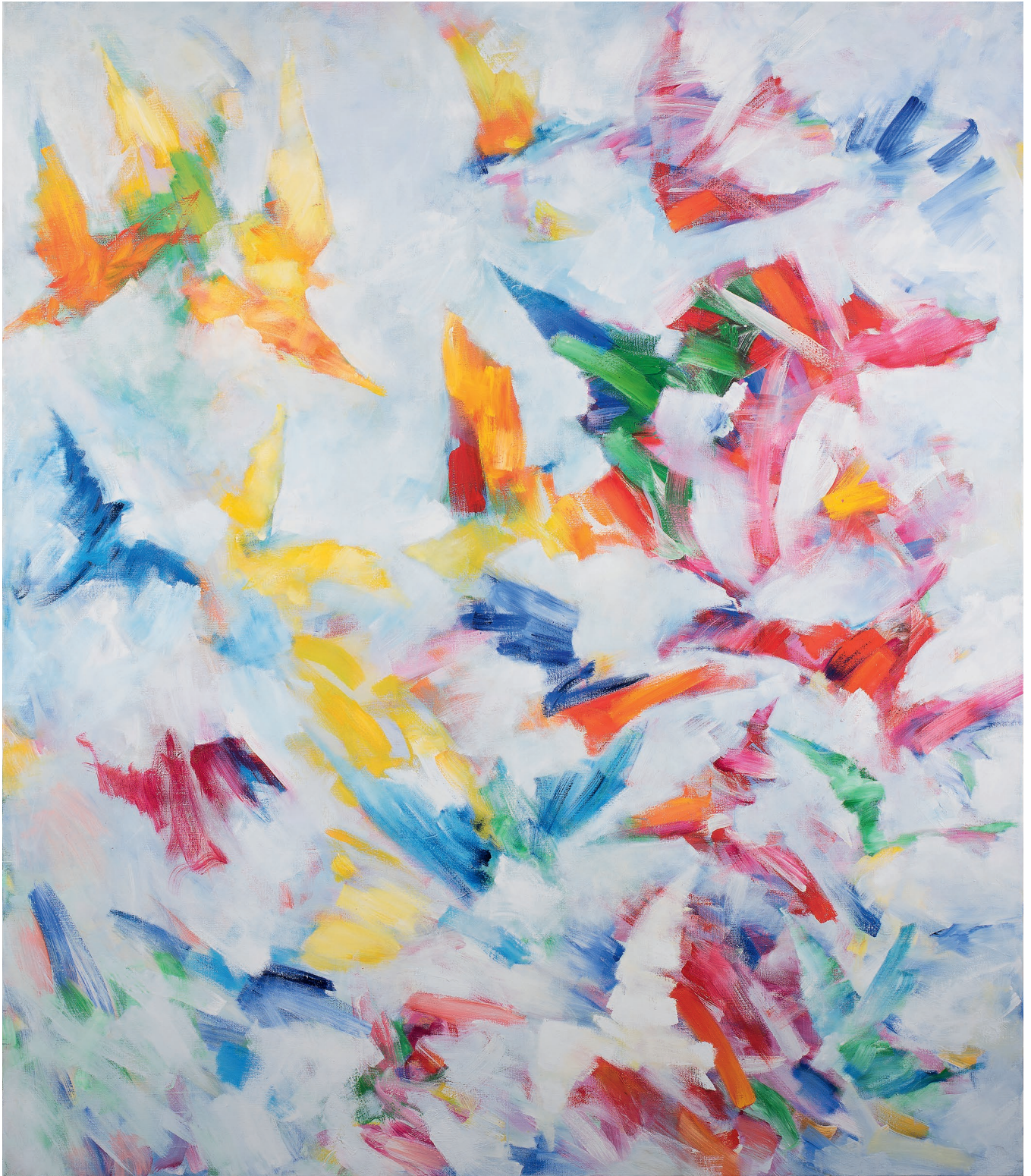
Freude Öl auf Leinwand, 190 x 220 cm